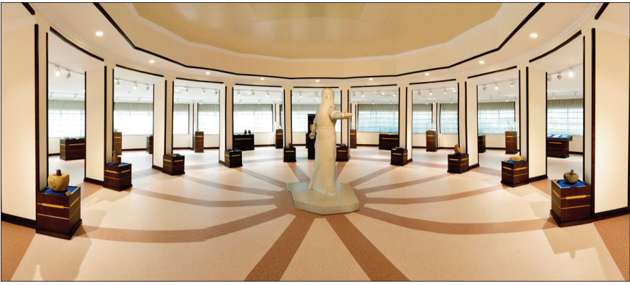
Naxçıvan Duz Muzeyi xalqımızın tarixinə, mədəniyyətinə, milli-mədəni dəyərlərinə göstərilən böyük qayğının bir ifadəsi kimi Naxçıvan Muxtar Respublikası Ali Məclisi Sədrinin 2017-ci il 12 sentyabr tarixli Sərəncamına əsasən yaradılıb, 2018-ci il aprel ayının 25-də isə istifadəyə verilib.

Çoxdandır, Naxçıvan duzunun tarixdə oynadığı mühüm rolun dünyaya çatdırılması, aparılan elmi araşdırmalar zamanı əldə olunan maddi mədəniyyət nümunələrinin qorunub saxlanması və təbliği məqsədilə yaradılan Naxçıvan Duz Muzeyinə bir yerdə getməyi planlaşdırırdıq. Bu mədəniyyət müəssisəsi ilə ümumi tanışlıq əsasında Naxçıvanın duz tarixinə yenidən nəzər salmaq, həmin qədim tarixi, mədəniyyəti gözlərimiz önündə canlandırmaq üçün bu ünvana yollanırıq.